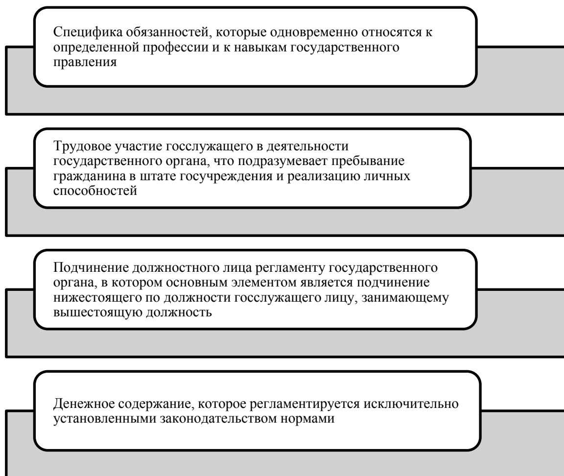
Рисунок 1. Характерные признаки государственной (муниципальной) гражданской службы

Именно государство в дальнейшем формирует различные государственные органы согласно принятому государственному аппарату.