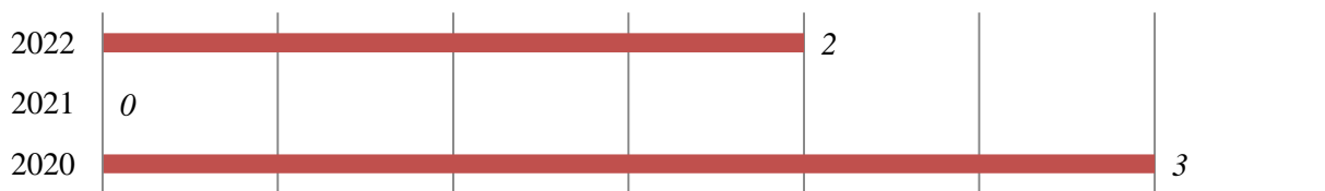
Рисунок 1. Статистика инцидентов в системах электроснабжения

С целью своевременной ликвидации и предупреждений отказов необходимо постоянно следить за техническим состоянием электрооборудования, своевременно предпринимая действия по предупреждению нештатных ситуаций. В основе сбора данных по числу выхода из строя энергетического оборудования проведен сбор данных по отказам силовых трансформаторов на одном нефтехимическом производстве Татарстана за период с 2020 по 2022 гг. В работе, на данном предприятии, используются трансформаторы в количестве более 600 шт. В данной статистике представлены аварии, повлекшие существенный экономический ущерб по недоотпуску продукции, долгому простое и значительным затратам на восстановление.