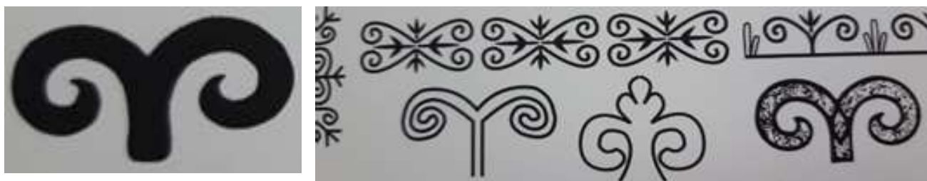
Рисунок 5. Рога горного барана

Частое изображение бараньих рогов в изделиях и предметах декоративно-прикладного искусства символизировало пожелание материального благополучия в семье. Кроме пищи, баран давал сырье: шерсть, кожу, кости и т. д., которое безотходно использовалось для одежды, домашней утвари и утепления жилища внутри и снаружи.