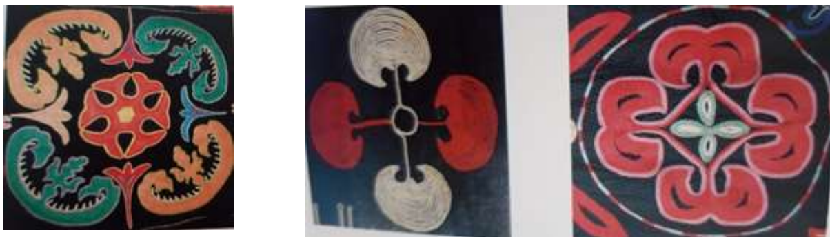
Рисунок 4. Анар – это символ плодородия и единства, счастливой семейной жизни

Треугольный амулет — его сакральное значение — это оберег от злых духов и сил, защищает его носителя от бед и злых сил. Используется среди других мотивов в круге, квадрате, в качестве каймы по краям изделий (Рисунок 3).