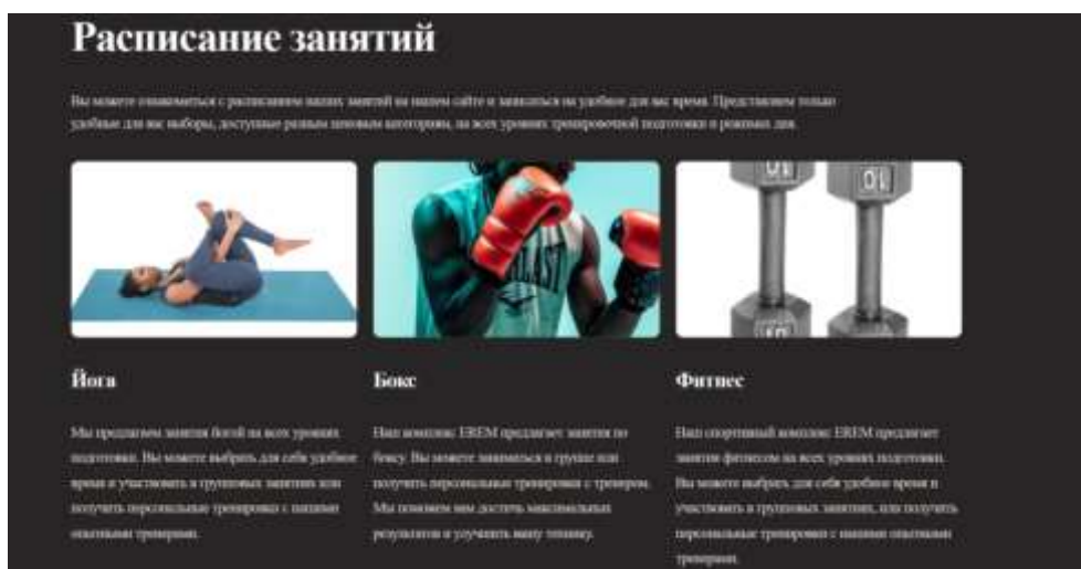
Рисунок 1. Расписание занятий

На странице раздел имеется и расписание интересующих занятий в определенный день недели. В результате в окне мы увидим следующее (Рисунок 1):