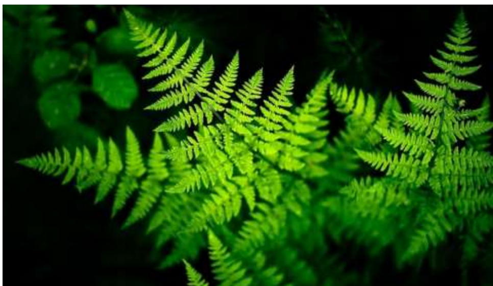
Рисунок 2. Лист папоротника

Вайи могут быть цельными, перисто-рассеченными, дважды или трижды перисто-рассеченными. Вайи в очертании могут быть овальными или треугольными [4]. в) Бесполое размножение папоротников осуществляется спорами, которые образуются в спорангиях. Спорангии расположены на нижней стороне и собраны в сорусы. У многих папоротников сорусы прикрыты тонкой чешуйкой. Спорангии располагаются на длинных ножках, которые прикрепляются к выступу вайи — плаценте. Снаружи спорангий покрыт однослойным многослойным покровом, который состоит из клеток двух типов: неравномерно утолщенных в виде подков, полукольцом опоясывающих спорангий (кольцо) и тонкостенных (устье). Внутри спорангия в процессе редукционного деления материнских клеток происходит образование спор. Каждая спора покрыта двумя оболочками: внутренней — эндоспорием и наружной — экзоспорием. Высыпавшиеся из спорангия споры попадают на влажную почву и прорастают. В результате образуется маленькое, до 1 см диаметром заросток. К почве прикрепляется с помощью ризоидов, расположенных на нижней стороне заростка. Архегонии формируются около выемки заростка, в ткань которого погружены их брюшки. Антеридии образуются на поверхности заростка ближе к ризоидам. В брюшке архегония образуется одна яйцеклетка, в антеридиях многожгутиковые сперматозоиды. Таким образом, заросток папоротника является обоеполым. После оплодотворения из образовавшейся зиготы развивается молодой зародыш-спорофит [4].