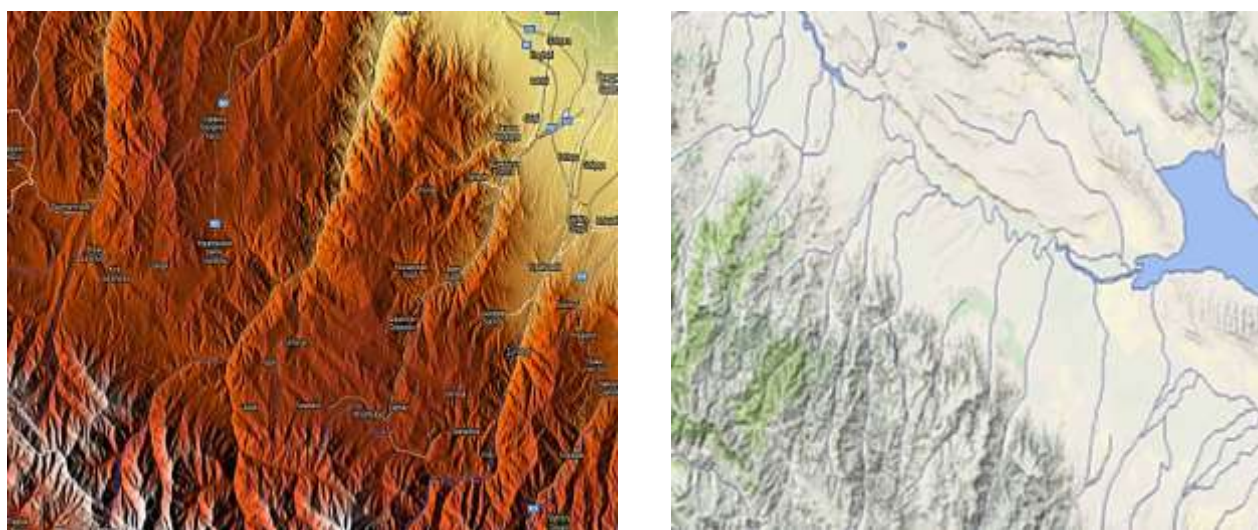
Рисунок 2. Вид рельефа в разных цветах на изучаемой территории (в SASPlanet)

болотно-подзолистых и болотных почв или к увеличению площадей заболоченных почв, в составе существовавших ранее подобных комбинаций. При распашке лесных слабодренированных территорий резко усиливается контрастность компонентов почвенного покрова по степени поверхностного оглеения, так как уменьшается транспирация и существенно усиливается поверхностное перераспределение влаги. Вся эта группа воздействий, приводящая к увеличению контрастности СПП, представляет собой почти всегда отрицательный результат воздействия человека на почвы, приводящий к снижению почвенного плодородия. Некоторые из таких процессов дифференциации почвенного покрова, возникающих в результате деятельности человека, усиливающих определенные природные процессы или создающих процессы, аналогичные природным, рассматривались вместе с соответствующими факторами дифференциации почвенного покрова, возникающими естественным путем (водно-эрозионный, эоловый, оползневый и др.). Но часть подобных факторов строго связана с деятельностью человека и не может возникнуть без ее участия; комбинации, возникшие в результате их воздействия, должны рассматриваться как антропогенные, причем их следует относить к антропогенным ненаправленным, возникающим как побочный результат деятельности человека, преследующей иные цели (Рисунок 2).