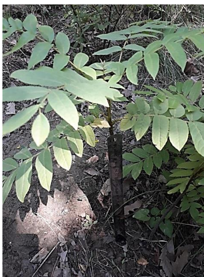
Рисунок 3. 3-летние всходы P. pterocarpa

Незначительное увеличение высоты трехлетних всходов объясняется постепенной адаптацией вида к засушливому субтропическому климату Апшерона (Рисунок 3).