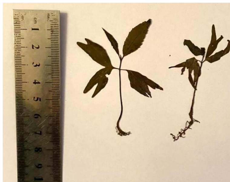
Рисунок 1. Проросток Pterocarya pterocarpa

Изучение всходов данного вида показало их слабый рост в первые дни (10 дней), а с третьей декады мая темпы роста всходов увеличиваются. Изучение ростовых характеристик исследуемых видов показало, что на 30-дневных всходах формируется 5 простых листочков и рост проростков достигает высоты 9,5 см (Рисунок 1).