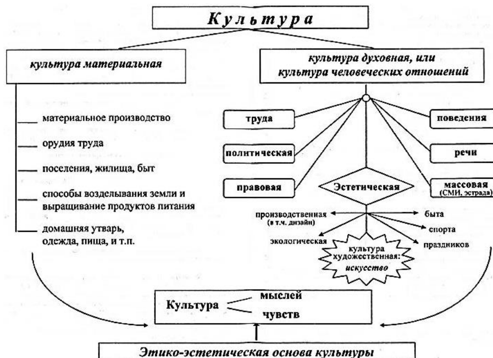
Рисунок 2. Структура музыкальной культуры личности

Дело формирования признаков музыкальной культуры не ограничивается образованием, оно формирует мировоззрение ребенка в результате пробуждения его внутренней души через воздействие на его чувства.