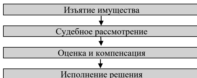
Рисунок 2. Этапы конституционно-правовой защиты права частной собственности

Схема ниже иллюстрирует взаимодействие государства и гражданина на этапах изъятия имущества и защиты права собственности.