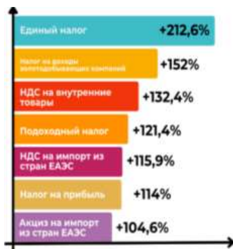
Рисунок 2. Классификация видов налоговых сборов, поступивших в 2024 г, % ( https://clck.ru/3N3ENt )

Данные показатели анализа показывают, что по данным ведомства, ключевыми источниками поступлений стали: НДС на внутренние товары — 39,4 млрд сом; НДС на импорт из стран ЕАЭС — 37,9 млрд сом; подоходный налог — 26,5 млрд сом; налог на прибыль — 20,1 млрд сом; налог на доходы золотодобывающих компаний — 16,1 млрд сом; единый налог — 15,08 млрд сом; акциз на импорт из стран ЕАЭС — 13,3 млрд сом. Увеличение налоговых сборов стало возможным благодаря улучшению налогового администрирования, усиленному мониторингу и анализу, а также внедрению современных цифровых технологий. Рассмотрим наглядно поступления по видам налогов по нижеследующему в 2024 г. В результате анализа можно выделить, что по сравнению с 2023 г наблюдается рост поступлений по видам налогообложения: НДС на внутренние товары увеличился на 9,6 млрд сом (+132,4%); НДС на импорт из стран ЕАЭС — на 5,2 млрд сом (+115,9%); подоходный налог — на 4,7 млрд сом (+121,4%); налог на прибыль — на 2,5 млрд сом (+114%); налог на доходы золотодобывающих компаний — на 5,5 млрд сом (+152%); акциз на импорт из стран ЕАЭС — на 587,7 млн сом (+104,6%) (Рисунок 2).