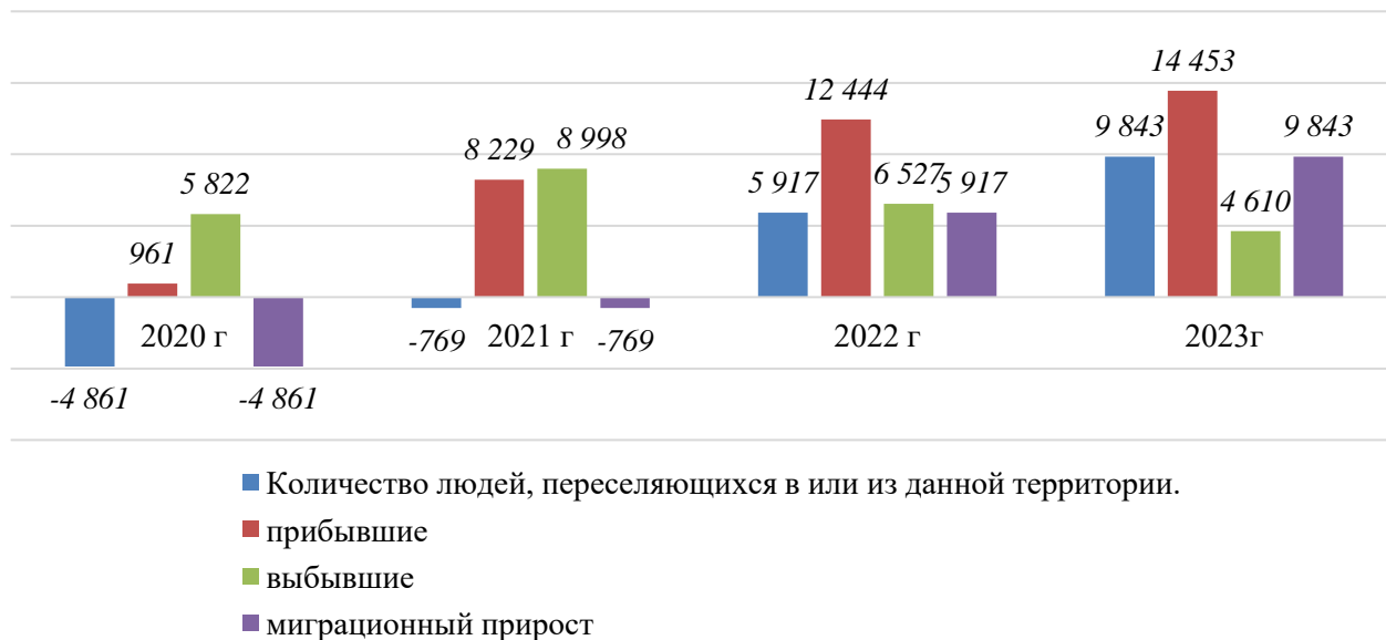
Рисунок 1. Миграция населения

может приводить к сокращению трудовых ресурсов внутри страны, что требует создания новых рабочих мест и улучшения условий труда для населения.