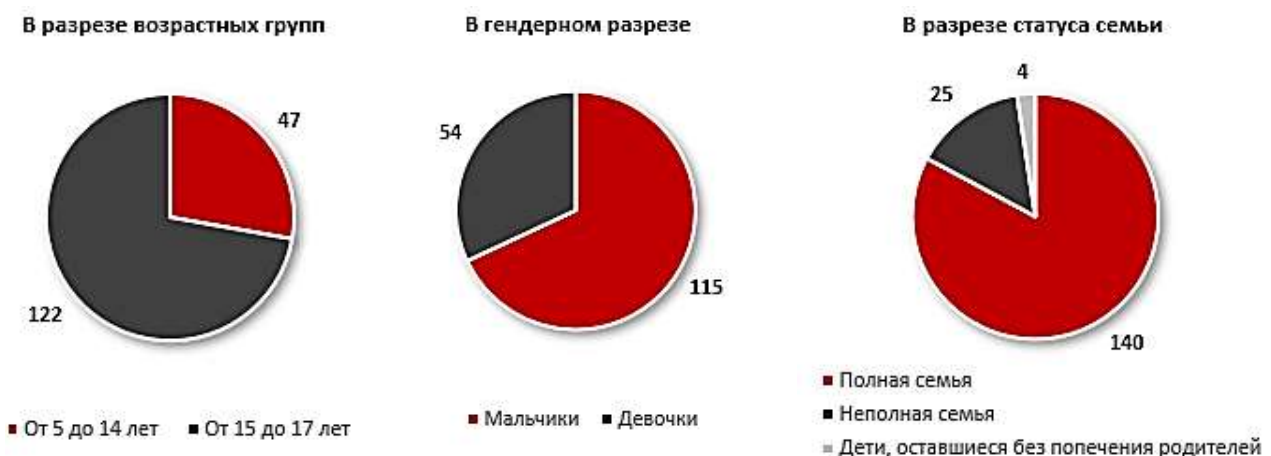
Рисунок 2. Сведения о завершенных суицидах несовершеннолетних (январь-октябрь 2023)

Больше стало и тех, кто попытался свести счеты с жизнью. Количество попыток суицида молодых казахстанцев в возрасте от 5 до 18 лет за год выросло на 17,8%: с 253 до 298 случаев. Не исключено, что их реальное количество было намного больше, ведь неудачные попытки суицида, которые обошлись без последствий, нередко нигде не фиксируются. Например, в России незафиксированных попыток подростковых самоубийств в 15 раз больше, чем учтенных. В Казахстане такой информации в открытом доступе нет.