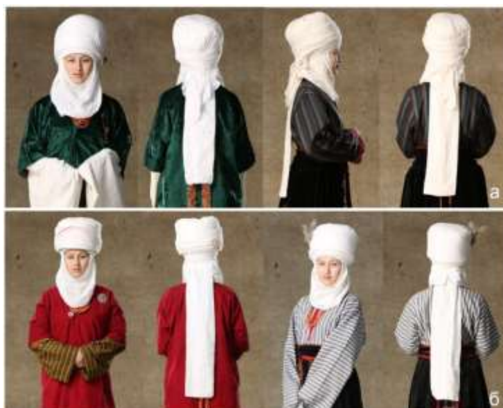
Рисунок 6. Виды элечеков Таласской области

Отличительной особенностью элечека второго вида является завершение наматывания отдельным куском ткани в виде платка, завязанного сзади на переднюю сторону (Рисунок 6 б). Все куски ткани элечека второго вида наматывают таким образом, что каждый оборот ткани вокруг головы выступает вверх от предыдущего на очень маленькое расстояние. При этом каждый слой ткани приподнимается на 1.5 мм только с задней стороны элечека (Рисунок 6б).