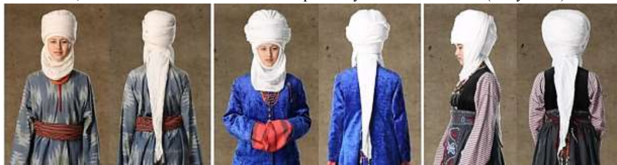
Рисунок 7. Виды элечеков Таласской области

Отличительная особенность элечека третьего вида в том, что завершение наматывания элечека происходит без применения куска ткани в виде платка. При завершении наматывания этого вида элечека используется последний кусок ткани. Свисающая вдоль спины белая полоса ткани, называемая «куйрукча», не пришивается отдельно, как в первом и во втором виде элечека, а является начальной частью первого куска ткани элечека (Рисунок 7).