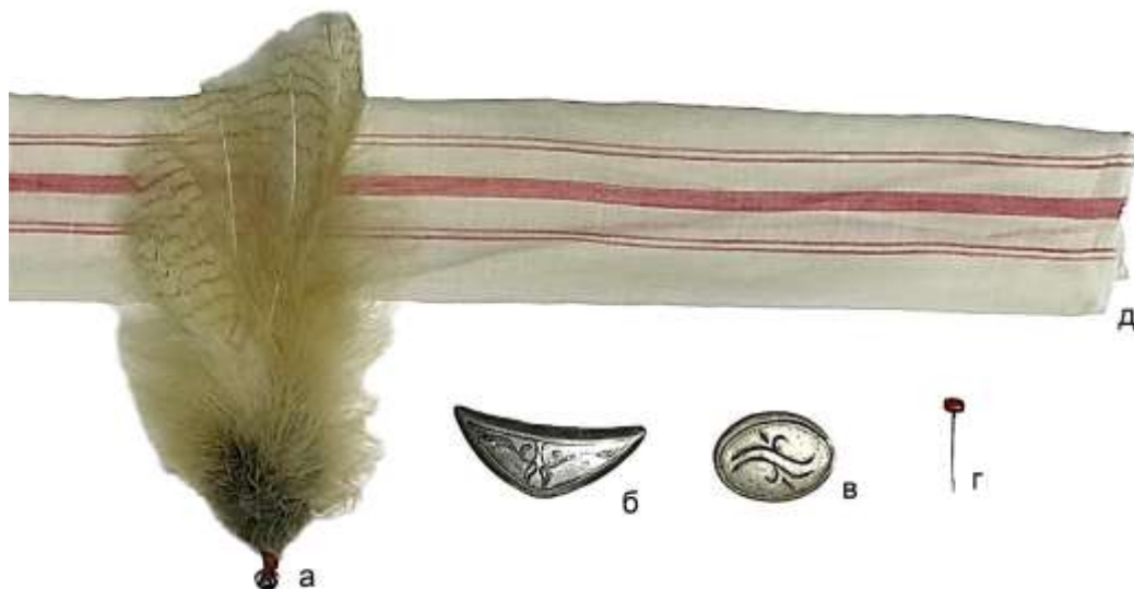
Рисунок 14. Декоративные детали северо-западных элечеков. Перья совы с бусинкой (а), серебрянная булавка «төөнөгүч» (б), серебрянная булавка «төөнөгүч» (в), булавка с кораллом (г), декоративная повязка из ткани «ыстанпул» (д).