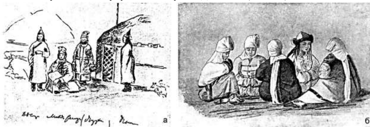
Рисунок 1. Традиционный женский головной убор элечек. (Зарисовки Ч. Валиханова (а), Рисунок П. М. Кошарова (б))

Одними из наиболее ранних зарисовок элечека были рисунки П. М. Кошарова и Чокана Валиханова (1857 год) (Рисунок 1). Также сведения о головном уборе кыргызских женщин элечеке содержатся в этнографическом очерке Н. Д. Зеланда (1885 год).