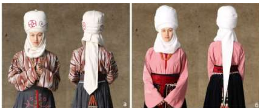
Рисунок 8. Виды элечек Джалал-Абадской области

Элечек Джалал-Абадской области имеет следующие отличительные особенности. Элечек Джалал-Абадской области имеет овальную форму и так же состоит из трех или четырех кусков ткани. Все куски ткани элечека наматывают таким образом, что каждый оборот ткани вокруг головы выступает вверх от предыдущего на маленькое расстояние. После наматывания основных кусков ткани, с целью придания нужной формы, на элечек завязывают большой платок или отдельный кусок ткани. Наиболее значимым отличием элечека Джалал-Абадской области является его деталь в виде белой полосы ткани, свисающая вдоль спины, под названием «куйрукча», которая не встречается в других регионах Кыргызстана. «Куйрукча» в Джалал-Абадской области выполняется в виде треугольника из двухслойной ткани (Рисунок 8а), или в виде треугольника из сложенной в четыре слоя из первого куска наматываемой ткани (Рисунок 8б). Последняя форма «куйрукча» встречается также в элечеке племени кытай [ПМА 1].