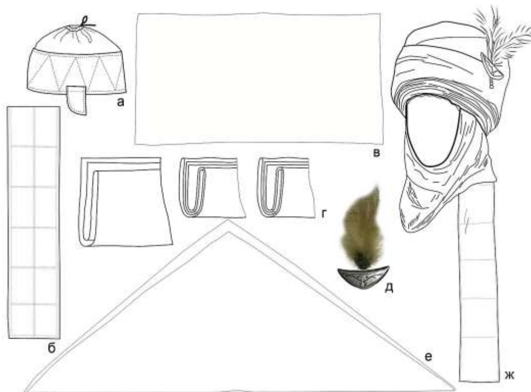
Рисунок 11. Комплект деталей элечека северо западного региона. Внутренняя шапочки (а), «куйрукча» спинная часть внутренней шапочки (б), сложенный ткань которая идет под подбородком «ээк алгыч» (в), обмотки тканей (г), серебрянная булавка с совиным перьями (д), платок (е), общий рисунок головного убора (ж)

внутреннюю шапочку пришивают «куйрукча» прямоугольной формы а в некоторых видах северо-западного комплекта элечека вместе «куйрукча» применяют сложенный в несколько слоев тот же кусок ткани, который используют для наматывания элечека. Только в северо-западном комплекте можно встретить вид элечека с двойным «куйрукча». Если одна заготовка «куйрукча» пришивается к внутренней шапочке, то вторая накладывается сверху из первого куса наматываемой ткани элечека. После наматывания всех кусков различными способами для завершения элечека завязывают платок.