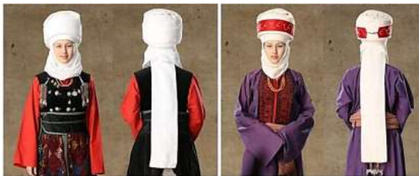
Рисунок 4. Виды элечек Нарынской области

Элечек Нарынской области имеет следующие отличительные особенности. Элечек имеет форму цилиндра, состоит из четырех, а иногда из пяти кусков ткани. Первые два куска ткани наматывают, приподнимая каждый слой вверх очень мелкими отступами в 1-1.5 мм. Другие куски ткани наматывают на одном и том же уровне, не поднимая слои вверх. После того как закончилась намотка отдельные куски тканей в конце наматывания ткань для наклона сворачивают в виде трубочки и наклоняют в одну сторону. Такой кусок ткани называют «джыгым». Со слов большинства информантов наклон «джыгым» делался на правую сторону. После наклона, обычно наматывают узкий кусок ткани или же декоративную повязку «кыргак». (Рисунок 4) [ПМА 1, ПМА2, ПМА 3].