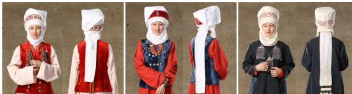
Рисунок 5. Виды элечек Иссык-Кульской области

Элечек Иссык-Кульской области имеет следующие отличительные особенности. Способы наматывания элечека Иссык-Кульской и Нарынской области имеют одинаковую основу. Основное отличие заключается в способе выполнения наклона «джыгым». Намотанный кусок ткани «джыгым» складывается в виде конверта и наклоняется в одну из сторон. Кроме куска ткани «джыгым» в Иссык-Кульской области при завершении наматывания элечека используют маленький платок «бүркөнчөк», которым покрывают элечек сверху (Рисунок 5) [ПМА 1].