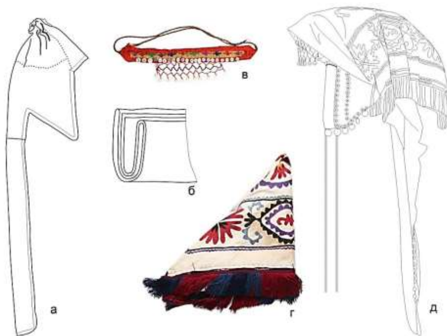
Рисунок 12. Комплект деталей элечека южного региона. Внутренняя шапочка «кеп такыя» (а), обмотка ткани (б), декоративная повязка «тартма» (в), платок «дурия» (г), общий рисунок головного убора (д).

Молодые невестки носили ярко украшенный головной убор небольшого объема. Элементом декорирования элечека молодых женщин была красная повязка «кыргак». Красному цвету, как в южных, так и в северных регионах придавалось особое значение. Красную повязку женщины носили до рождения трех или четырех детей, после рождения которых они могли носить повязки, декорированные серебряными вставками, вышивкой и кораллами. Объем элечека традиционно возрастал с возрастом женщины. Пожилые женщины носили элечек без декорирования.