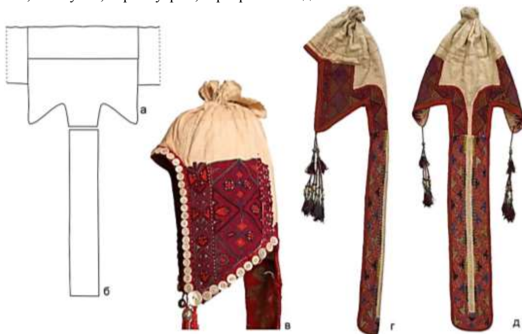
Рисунок 3. Второй вид внутренней шапочки «кеп такыя». Крой внутренней шапочки (а), тыльная часть внутренней шапочки «куйрукча» (б), вид сбоку готовой шапочки (в), общий вид с боку (г), общий вид сзади (д).

Второй вид внутренней шапочки называют «кеп такыя» и его же называют «баш кеп», «чач кеп» или «кеп чач» (Рисунок 3). Это вид внутренней шапочки декорируется вышивкой, кораллами, жемчугом, перламутром, серебрянными деталями и кисточками.