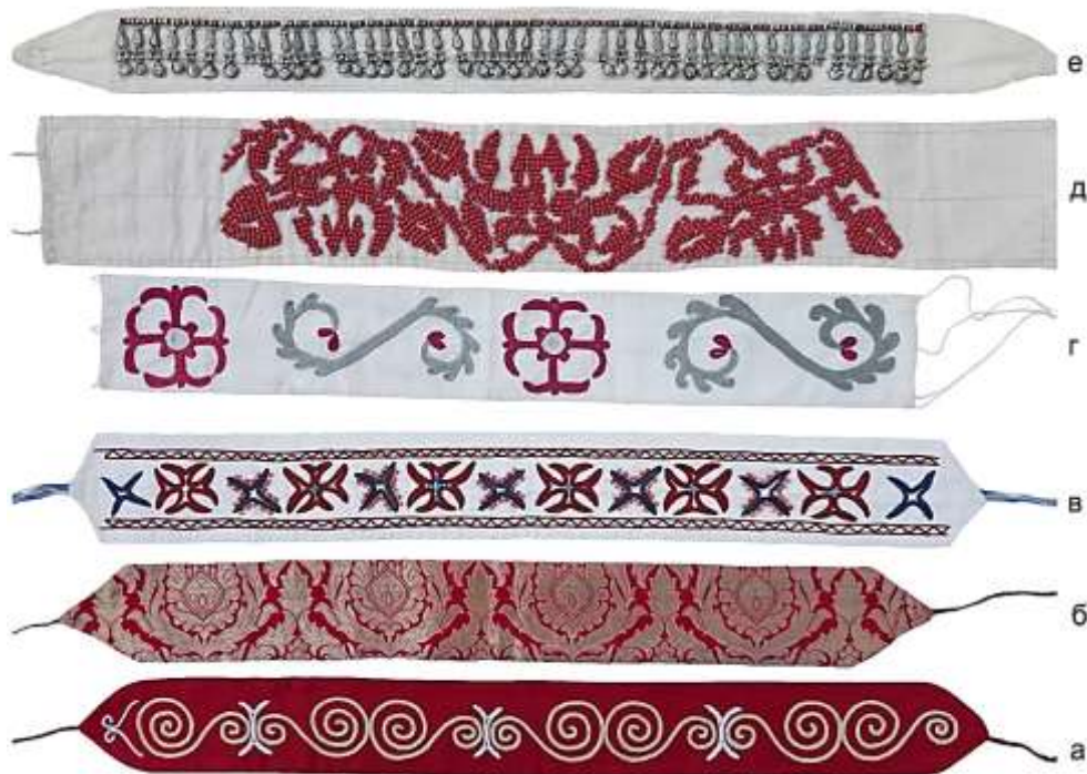
Рисунок 13. Декоративные детали северного элечека. Декоративная повязка «кызыл кыргак» (а), декоративная повязка из парчи (б), декоративная повязка с вышивкой и кораллами (в), декоративная повязка «сайма кыргак» (г), декоративная повязка «шуру кыргак» (д), декоративная повязка с серебряными вставками (е)

повязки, вышитые и украшенные бисером. В декорировании также использовали платок «дурия» с вышитым одним углом, с кисточками и с серебряными деталями (Рисунок 15).