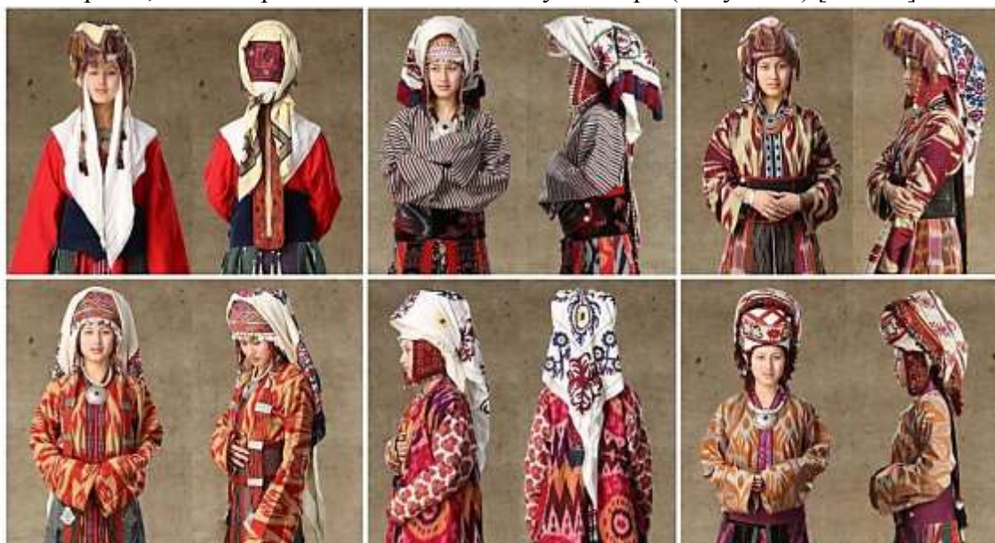
Рисунок 9. Виды элечек Ошской области

Элечек Ошской области имеет следующие отличительные особенности. Все виды элечека этого региона наматываются поверх внутренней шапочки «кеп такыя» с использованием, как правило, одного или двух кусков ткани. Особенностью Ошского элечека является наматывание кусков ткани без соблюдения четких линий намотанных слоев. Элечек Ошской области имеет различные формы, — одни смещены вперед, другие свисают с тыльной стороны, а некоторые значительно вытянуты вверх (Рисунок 9) [ПМА1].