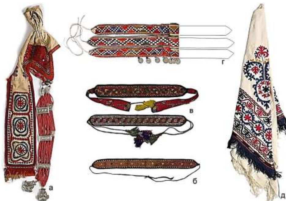
Рисунок 15. Декоративные детали южного элечека. Внутренняя шапочка «кеп такыя» (а), декоративная повязка вышивкой (б), декоративные повязки «тартма» (в), декоративная повязка «тартма» (г), платок «дурия» (д)